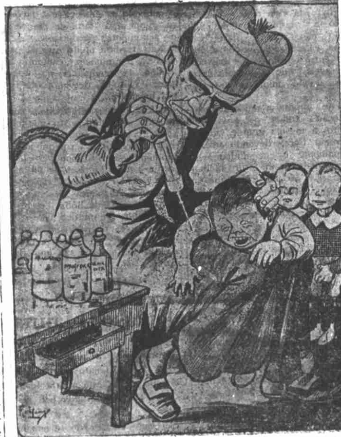
Inoculando o odio ao progresso, á humanidade que nasce.

Tal é a instrução propinada pelos jesuitas, com que os pais se enganam, e com que se iludem os examinadores, mas que prepara uma geração de idiotas, marcados pela vesania religiosa.